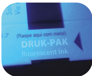
Nadruk farbami fluorescencyjnymi