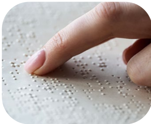
Aplikacja pisma Braille'a

Oferujemy wiele metod uszlachetnienia. Wszystko po to, aby Twój produkt wyróżniał się na półkach sklepowych.