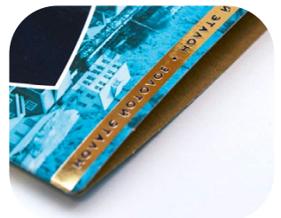
Termodruk (Hot foil stamping)