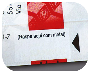
Kombinacja lakierów z podwójnym efektem

Specjalizujemy się również w zaawansowanych metodach zabezpieczania opakowań przed fałszerstwem.