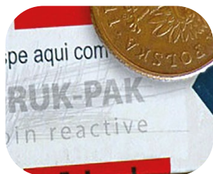
Atrament reaktywny (Coin reactive)