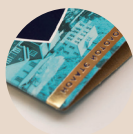
Hot foil stamping