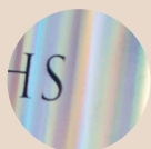
Anvendelse af hologrammer