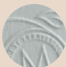
Embossing og debossing